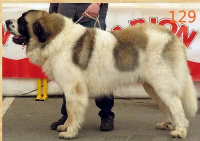
Ch. E. Bordagaray Ben Nevis Mejor Mostin 2013 Campeón de España 2013