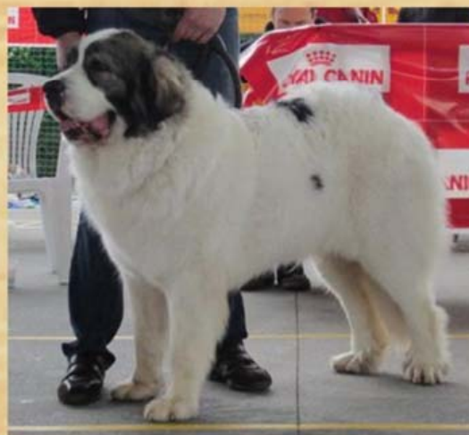
Ch. Dafne de Cantarranas Mejor Mostina 2013 Campeona de España 2014